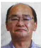
シーキューブ(株) 三重支店 社員一同 様