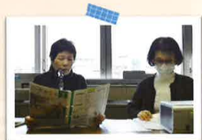
40~70代のメンバーが 楽しく活動しています♪