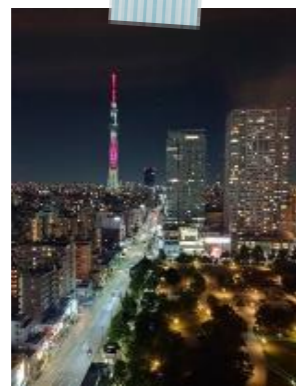
夜景がやけにキレイさん 『旅の思い出』