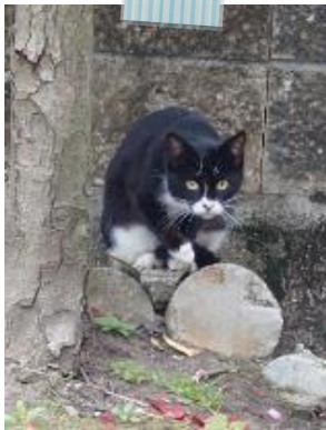
くろねこさん 『狙ってる?』