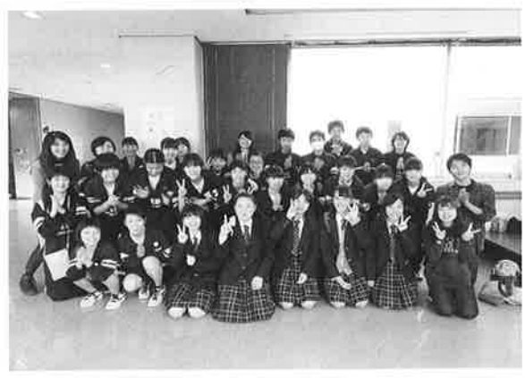
学生ボランティアの皆さん

11月3日、秋晴れの心地よいお天気の中、川越ふれあい祭2017が開催されました。