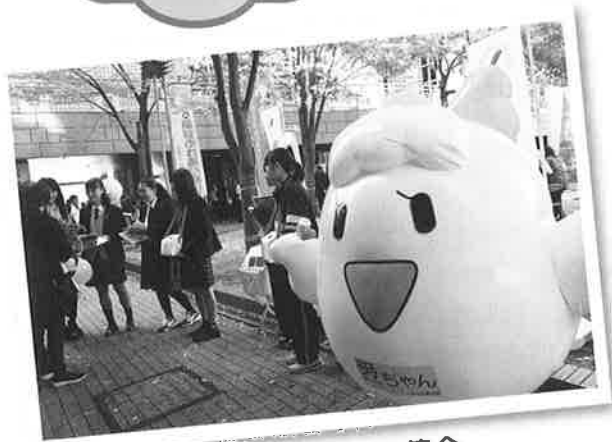
赤い羽根共同募金