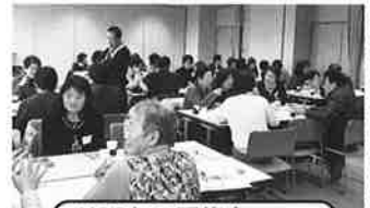
H28年の研修会 「ボランティアとご縁」 というテーマで開催