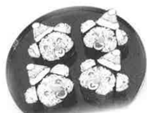
くまちゃんサンタ