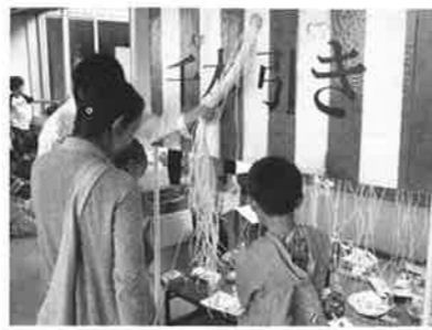
昭和レトロ縁日・千本引き