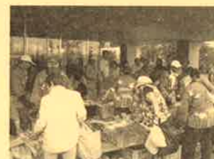
ふれあい広場朝市