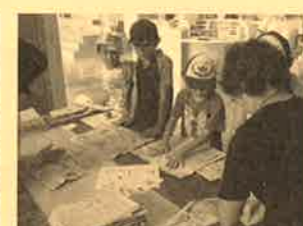
新聞スリッパづくり