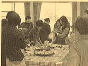
手打ちそばやおにぎりなどが振る舞われました