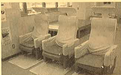
新しいヘルストロン“スカイウェル”

いきいきセンター3階でご使用いただいていた電位治療器「ヘルストロン」が4月より新しくなりました。名前も「スカイウェル」と新しく変わり、さっそく多くの方にご利用いただいております。効能効果(頭痛・肩こり・不眠症・慢性便秘の緩解)もヘルストロンと変わりなく効果を発揮します。開館時間内(月～金曜日の8:30～17:00まで)であればどなたでもご利用いただけますので、気軽にセンターまでお越しください。