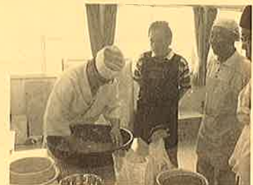
そば打ち体験教室実施中!!