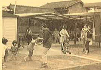
子供たちのはしゃぐ姿が印象的でした♪